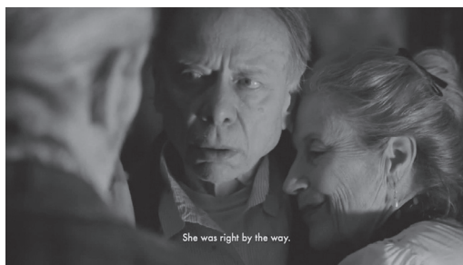
She was right by the way.

Franco, un uomo anziano, vive in serenità con la moglie Margherita. L'arrivo del fratello Vittorio, contro cui cova un antico risentimento, provoca situazioni insospettabili.